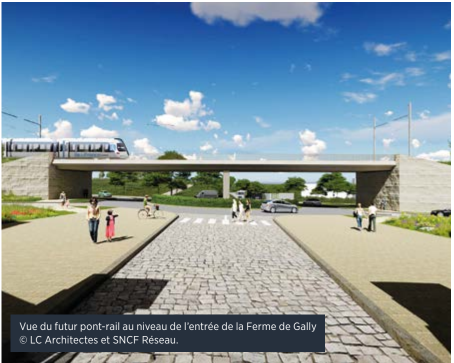
Vue du futur pont-rail au niveau de l'entrée de la Ferme de Gally © LC Architectes et SNCF Réseau.