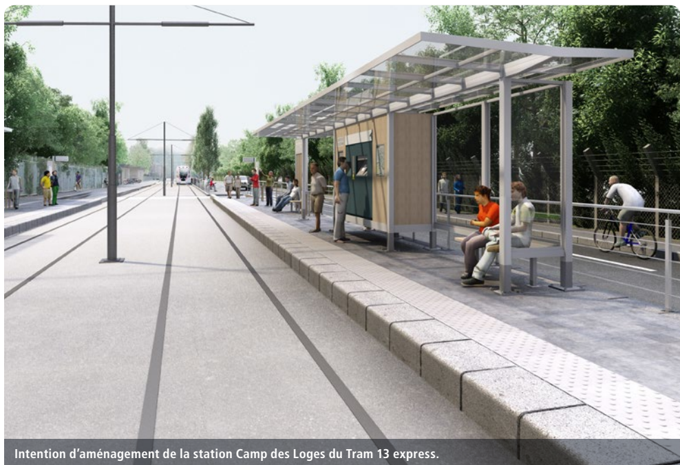
Intention d'aménagement de la station Camp des Loges du Tram 13 express.